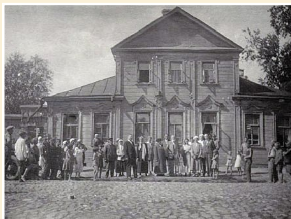
И.П. Павлов с жителями г. Рязани на фоне родительского дома в 1935 году.