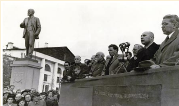
Открытие памятника академику И.П. Павлову в 1949 году. (В первом ряду четвертый справа академик П.К. Анохин, далее академик Л.А. Орбели, второй слева – чл. корр. АМН СССР А.И. Смирнов).

родился и жил с 1849 по 1870 г. академик И.П. Павлов». С 1993 г. музей имеет статус «Мемориальный музей-усадьба академика И.П. Павлова».