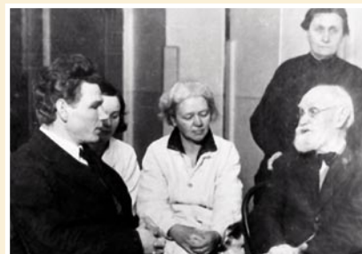
И.П. Павлов (крайний справа) и один из его выдающихся учеников – академик П.К. Анохин (крайний слева) при обсуждении результатов исследований (фотография из открытых источников).