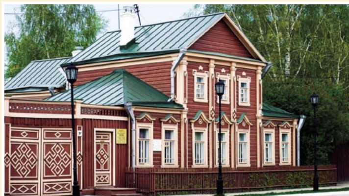
Дом, в котором родился И.П. Павлов (фотография 1926 г. из открытых источников).