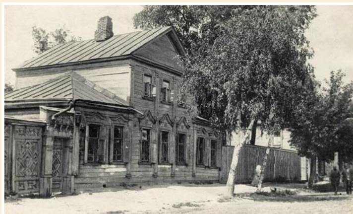
Дом, в котором родился И.П. Павлов (фотография 1926 г. из открытых источников).